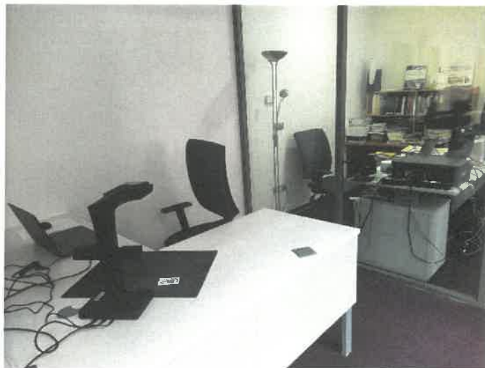
A győri telephelyre beszerzett irodai székek a kutatóteremben és a levéltáros munkaállomáson