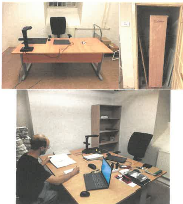
A beszerzett eszközök kicsomagolása (fent) és a berendezett kutatóterem és levéltáros munkaállomása a mosonmagyaróvári telephelyen

A Széchenyi István Egyetem mosonmagyaróvári telephelyén működő levéltár a Mezőgazdaság- és Élelmiszertudományi Kar (2022. augusztus 1-től Albert Kázmér Mosonmagyaróvári Kar) és elődintézményei iratanyagát őrzi. A támogatási időszak alatt sikerült a levéltár raktárához közel egy 15 m 2 -es alapterületű helységet megszerezni és a támogatás lehetővé tette, hogy kutató- és ügyfélszolgálat ellátására alkalmas szolgálatóteret alakítsunk ki benne. A támogatásból beszerzett íróasztal, irodai szék, rendezvényasztalként és iratrendezésre is használható összecsukható asztal és könyvespolc került itt elhelyezésre.