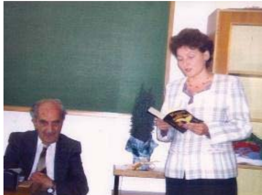
12. ábra: TDK-versenyen mint zsűritag a TDK kari elnökkel