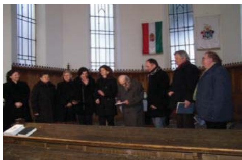
23. ábra: Előadások kórusával