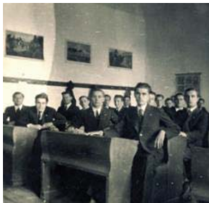
7. és 8. ábra: Érettségi képe, gimnazista osztálytársakkal 1938-ban Sárospatakon