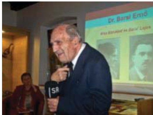
6. ábra: Szüleiről mesél Szencen a Nemzedékek nevelői a Tanítók és tanítócsaládok a Kárpát-medencében című könyv bemutatóján 2012-ben