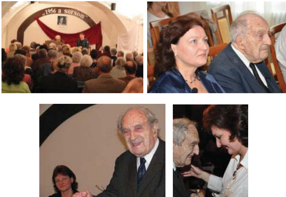
29. ábra: Közös előadásaink képeiből