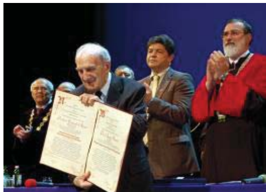
13. ábra: A kitüntetés átvétele 2010-ben

Kiváló munkájának elismeréseként 2010. július 3-án az egyetem rektorától, dr. Faragó Sándortól vette át a Nyugat-magyarországi Egyetem Díszpolgára címet.