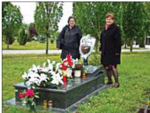
31. ábra: Győri Díszpolgárok sírhelyénél lányával 2014.