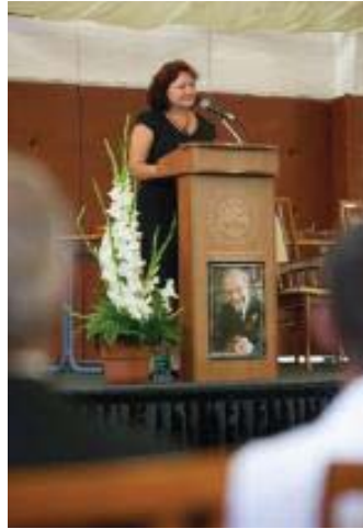
30. ábra: Búcsúztatása a főiskolán 2013.

tovább a „fáklyát”. Nagy tapsot kapott – mint mindig – az utolsó előadásán is szobatársaitól. Sajnos én búcsúztattam a tanítványok nevében karunkon 2013-ban (Lanczendorfer 2014a: 74–78).