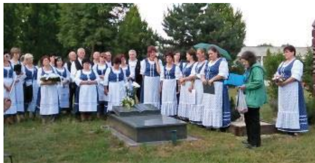
22. ábra: Pünkösdi Dalostalálkozó a sírjánál