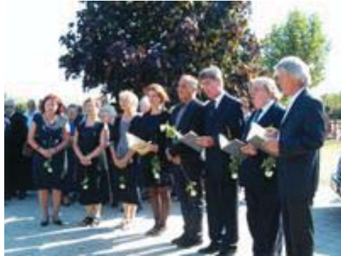
24. ábra: Goudimel: „Tégy jól és bízzál erősen Istenben...”

Kórusvezetőnket a CD-n is énekelt, általa nagyon szeretett Goudimel-zsoltárral búcsúztattuk a temetésén, 2013-ban.