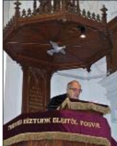
4. és 5. ábra: A hegedűtanár és az ígehirdető

Ernő bácsi szülei, Barsi Lajos és Kiss Erzsébet református iskolában tanítottak. Édesapja Szőnyből, édesanyja pedig az erdélyi Málnásról származott.