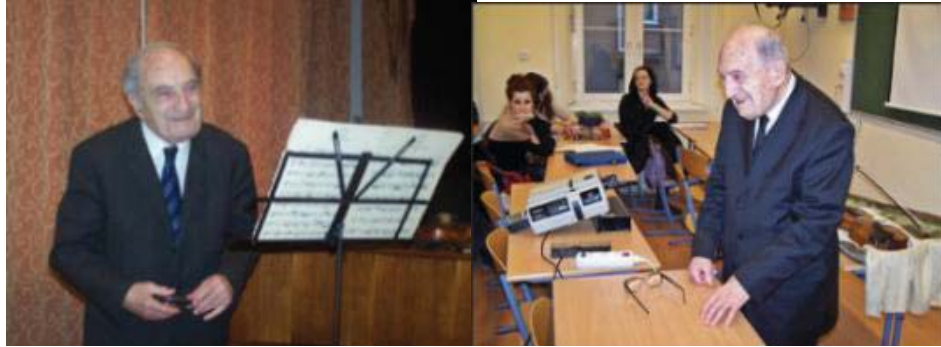
14. és 15. ábra: Előadásai a főiskolán