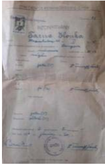
26. ábra: Zeneiskolai bizonyítvány 1956-ból