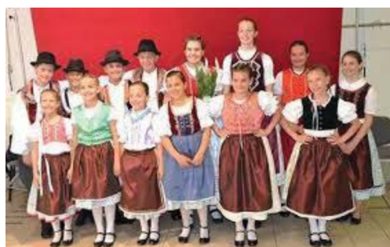
32. ábra: „Névörzök”