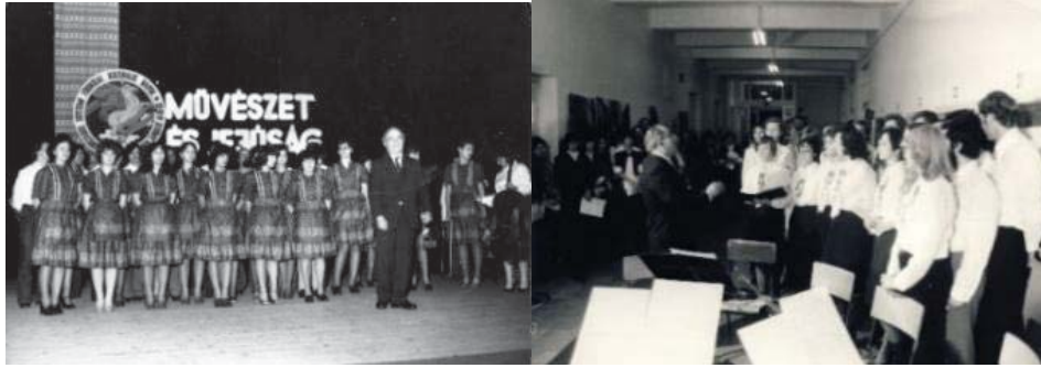
10. és 11. ábra: Tanítóképző kamarakórusával szerepléseken

XXIV. Apáczai-napok Tudományos Konferencia tanulmánykötete