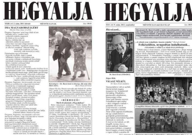
18. ábra: A Hegyalja újság címlapjai

Rendszeresen járt terepen, népdalgyűjtő utakon. Az első gyűjtéseikor még 40 kg súlyú magnót vitt magával. Gyakorta vette hasznát, hogy megtanult korábban gyorsírní. A gyűjtéseiből számos könyvet, tanulmányt írt (lásd bibliográfiái: Lanczendorfer 1995d: 145–158, 2000: 83–88; Léránt 2010: 167–198). Szívén viselte a szülőföld értékeinek, kincseinek feltérképezését, a honismereti, helytörténeti kutatást. A gyökerek megbecsülését, a táj kutatást is nagyon fontosnak tartotta (Rábaköz, „ezersziget országa” a Szigetköz, Sokoróalja). Életműve elsősorban Győr-Moson-Sopron megye néprajzi kutatásához kötődik. Természetesen gyűjtötte azonban szülőföldjének a Bükkaljának néprajzi kincseit, de kutatott a Balaton-felvidéken, határon kívüli magyaroknál: Csallóközben, Zoborvidéken, Burgenlandban és Gyimesben is.