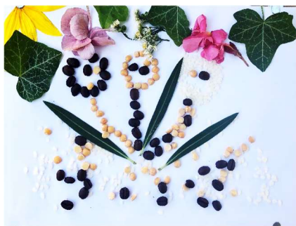
2. kép: Virágzó nőiség

A Világszépe-korszakot, az ifjúkort célzó elméleti áttekintést követően menyasszonyságát, fiatalasszonyságát emelte ki saját ifjúkorából, amely számára negatív élményként maradt meg, hiszen megalapozatlannak, korainak érezte a házasodást. Tanulásként fogalmazta meg, hogy mai gondolkodása nyomán nem engedné befolyásolni magát mások (anyós, vőlegény) akarata, vágyai mentén, hanem saját megérzéseire hallgatna. Elmondása szerint válását követően tudta megélni virágzó nőiségét.