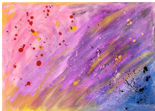
3. kép: Párkapcsolatra érett nő

A relaxációban már gyakorlottan vett részt, ezúttal színek jelentek meg számára. Vízfestékek készített alkotásában (3. kép) sokszínűség, mozgás, remény jelent meg. Ecsetvezetése olykor dinamikus, olykor pedig kicsi részletek segítségével elaborált. Elmondása alapján dülő női-férfi indulatokat, sokszínű reakciókat, s a feszültségek között megbúvó örömeket, reménysugarakat látott saját alkotásában.