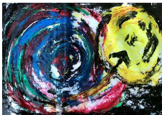
5. kép: Az emberélet útjának felén

Az alkotásnál megjelölt technikát (ujjfestés tapétaragasztó és tempera felhasználásával) első hallásra gyermekinek találta, a folyamatot követően azonban örömről, a feszültségek oldódásáról, dinamizmusról, felszabadultságról számolt be. Festményén (5. kép) színes koncentrikus körök segítségével jelenítette meg élete hullámzó folyamatát, amely egészen kicsi magból indult ki, s a hatalmas íveken át egészen a holdig ért el.