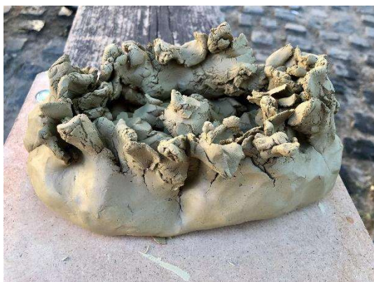
4. kép: Anya-fészek

Mélyen megérintette a mű: könnyezett, időbe telt megfogalmaznia felszínre törő érzéseit, gondolatait. Traumatikus emlékként felidézte szenvedélybeteg édesanyja viselkedéses mechanizmusait, amelyek meglehetősen távol álltak az „elég jó anya” koncepciójától. Beszért szorongásairól, amelyek saját magában való bizalmatlanságából, bizonytalanságából fakadtak, s azt is elmondta, sokszor megkérdőjelezi, hogy az anyasággal önmaga egyes részeinek feladása, a szenvedés, a gyermeknek önmaga adása megéri, megérte-e, de mint mindig és ezúttal is arra a következtetésre jutott, hogy igen, mert feltétel nélkül szereti a fiát.