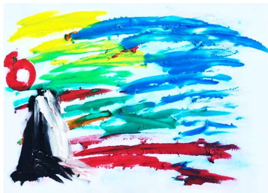
1. kép: A tizenkét hónap

Mélyre Tekintő az első terápiás alkalomról kellemes élményekkel, felszínre került emlékekkel, érzésekkel távozott. Az összegzéskor kiemelte a felismerést, hogy a volt férje iránti ellenszenve negatív irányba befolyásolta a többféleképpen értelmezhető párkapcsolati helyzet megítélését. Véleménye szerint „elgondolkodtató, hogy párkapcsolati konfliktusaiban, szakításaiban is ez a rossz berögződés térhetett-e korábban vissza”.