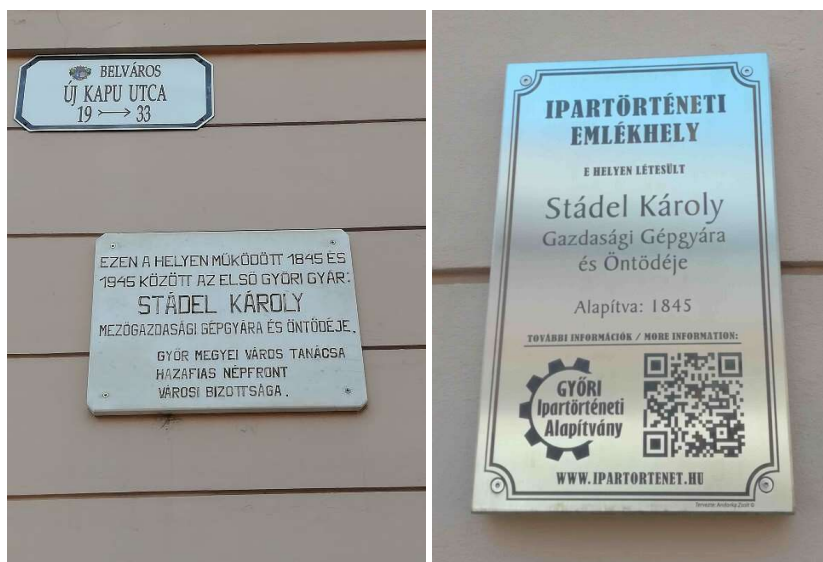
12. kép: Emléktábla az Új Kapu utcában a Stádel Gépgyár helyén. 111 112