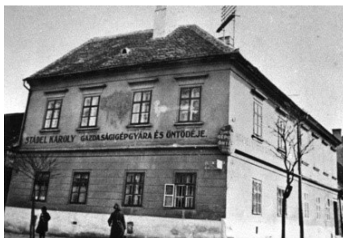
13. kép: Stádel Károly Gazdaságigépgyára és Öntődéje egy korábbi felvételen.