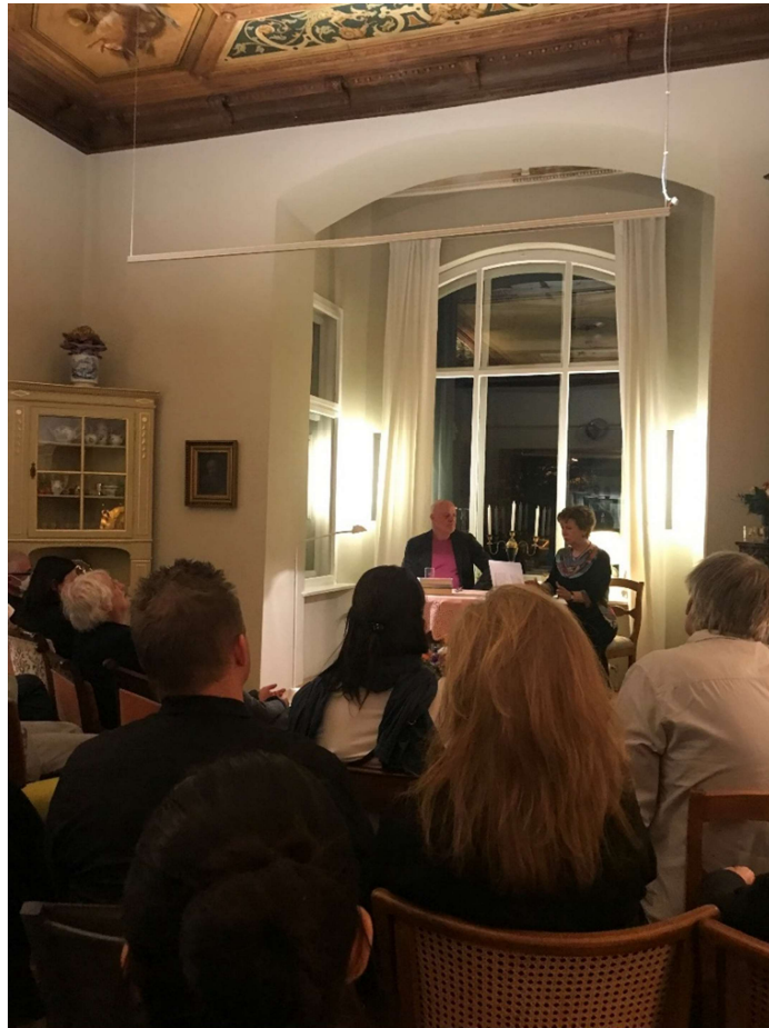
2. számú ábra: Szalonest a Berlini Szalonban

Napjainkban, átlagban évi négy kulturális rendezvénnyel szólítják meg a közönséget. ( https://www.berlini-szalon.de ) A Berlini Szalon ötven éves történetére visszatekintve azt állapíthatjuk meg, hogy a kezdetben szervezett író-olvasó találkozókól indulva az estek tematikája és műfaja folyamatosan bővült és színesedett. Jelenleg is dominálnak az irodalmi estek, ezeket követik gyakoriságban a művészportrék, harmadik helyen a hangversenyek következnek. Az est témájának és műfajának megválasztása a szervező döntése, melyet bizonyos esetekben pragmatikus szempontok is befolyásolnak, Berlinben tartózkodó ösztöndíjas művészek, vagy egyéb okból idelátogató előadók sokszor a Berlini Szalonba is meghívást kapnak. A rendezvényekről az érdeklődők e-mailben vagy a Szalon Facebook oldaláról értesülnek. A szervező címlistája jelenleg kb. 460 aktív címet tartalmaz, ebből nagyjából 300 magyar származású tagot. A szalonesteken műfajtól és témától függően 30 és 60 fő közötti a résztvevők száma.