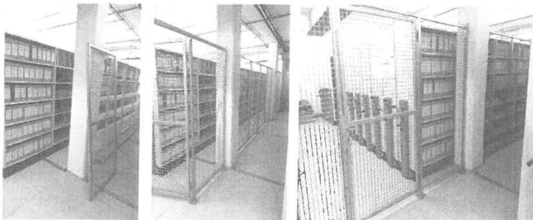
A levéltári raktár leválasztásának munkafázisai

3. A Széchenyi István Egyetem Egyetemi Könyvtár és Levéltár központi egységénél levéltári raktár leválasztása a könyvtári raktárrészről. A munkát 2022. februárjában végezték el a kivitelező cég munkatársai, a leválasztott levéltári térbe így csak a levéltáros jut be. Az emelkedő anyagárak és munkaköltség miatt ez a tétel az eredeti tervnél nagyobb költséggel járt, ezért páramentesítő készüléket nem vásároltunk, az A/3 méretű hordozható szkennert pedig más pályázati forrásból szereztünk be a mosonmagyaróvári telephelyre.