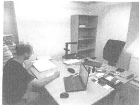
A levéltári iroda és kutatóhelyiség a győri és a mosonmagyaróvári telephelyen

3. A Széchenyi István Egyetem Egyetemi Könyvtár és Levéltár központi egységnél levéltári raktár leválasztása a könyvtári raktárrészről. Ezzel a levéltári raktár megfelel a levéltári törvény által megkövetelt feltételnek.