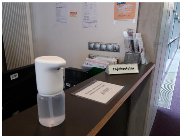
KÖZPONTI KÖNYVTÁR KÖLCSÖNZÓPULT ÉS TÁJÉKOZTATÓ PULT