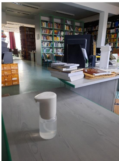
DFÁJK - TAGKÖNYVTÁR